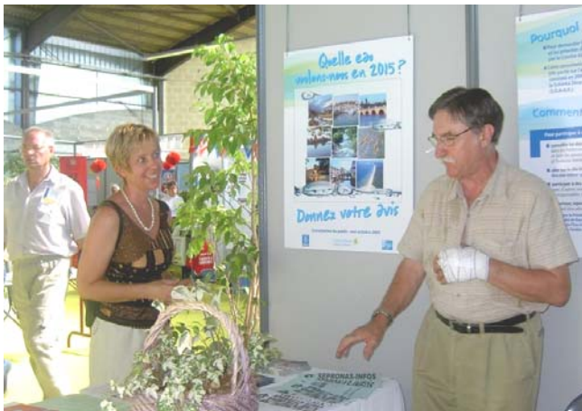
Stand tenu par Nature Environnement 17