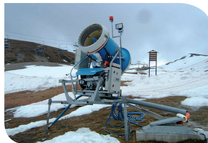
Canon à neige - Peyragudes (65)

L'emballlement des « résidences de tourisme » inconsidérément favorisées par des mesures fiscales (dites Demessine) est à mettre en parallèle avec l'extension des domaines skiables et des usines à neige. La poursuite des unités touristiques nouvelles, complètement déconnectées du marché mais assurées d'avantages fiscaux, de financements publics par l'Etat (pôles touristiques), de subventions régionales ou départementales (canons à neige) contribue à la non maîtrise de l'étalement urbain (problème d'assainissement). Les stations doivent gérer des pôles d'urbanisation aux demandes sociales de plus en plus contradictoires : centre ancien de village, station de ski satellite, urbanisation pied de piste, Unités Touristiques Nouvelles (UTN) ou résidence de promoteur à l'écart ... Tout cela psychologiquement fondé sur l'assurance d'une neige éternelle.