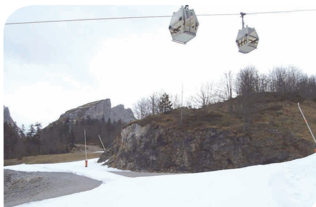
Couverture de neige artificielle sur terrain nu, Gourette

Par exemple : maîtriser l'étalement urbain avec la mise en place d'outils réglementaires : stabilité des documents d'urbanisme à une échelle pertinente dans le temps (10-15 ans) et dans l'espace (vallée, « pays »), renforcement du principe de construction en continuité, interdiction de toutes nouvelles liaisons inter-stations, moratoire sur l'extension des domaines skiables, législation foncière favorable à l'habitat permanent, fiscalité favorable aux communes préservant leur patrimoine naturel.