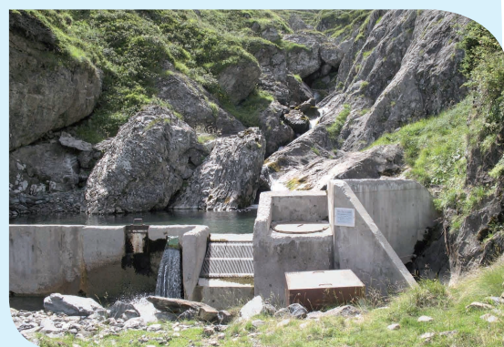
Gourette (64) prélèvement sur le Valentin

La station de Gavarnie 4 pompe l'eau directement dans le ruisseau d'Holle. Ce prélèvement suscite d'autant plus d'interrogations sur l'impact pour l'écoulement du torrent qu'un ouvrage EDF en amont ne laisse passer qu'un débit réservé pendant toute la saison hivernale. Le débit annoncé par EDF, à la centrale de Pragnères, est de 6 l/s, soit 21,6 m 3 /h et la puissance de pompage dans le torrent pour l'alimentation des canons est de 40 m 3 /h. Ainsi, le débit consenti par EDF dans le cours d'eau lors des prélèvements est inférieur à la puissance du pompage qui alimente le réseau neige de culture.