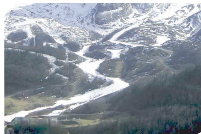
Gourette (64), piste des Rhododendrons enneigée artificiellement dans sa globalité

Dans les 18 stations, le volume prélevé est supérieur à 2 millions de m 3 sur un massif recouvrant 29500 km 2 . Comparativement, les 119 stations recensées lors de l'étude sur le bassin Rhône- Méditerranée- Corse en 2002 prélevaient 10 millions de m 3 pour un bassin hydrographique recouvrant un territoire de 130 000 km 2 .