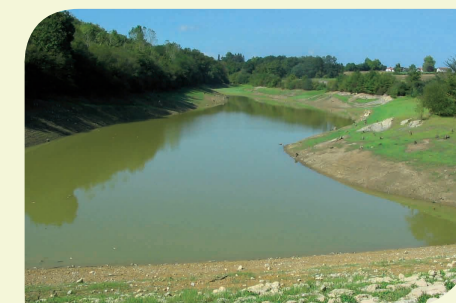
Lac à usage agricole Masparraute (64)

La construction de nouvelles retenues doit se faire en dernier recours (ou pour des usages vitaux), l'étude de toute solution alternative et l'analyse coûts/bénéfices devant démontrer qu'il n'existe pas d'autres solutions. Les retenues de substitution doivent être interdites en lit majeur, zones humides, têtes de bassin, cours d'eau réservés, réservoirs biologiques... Les retenues doivent être inférieures aux volumes historiquement prélevés (80 %), les remplissages ne doivent se faire qu'en période d'excédent, et leur gestion en totale transparence. La seule référence aux PGE pour réaliser et utiliser de tels aménagements est inadmissible.