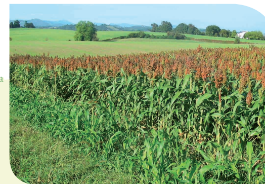
Champs de Sorgho Pays Basque (64)

La construction de nouvelles retenues doit se faire en dernier recours (ou pour des usages vitaux), l'étude de toute solution alternative et l'analyse coûts/bénéfices devant démontrer qu'il n'existe pas d'autres solutions. Les retenues de substitution doivent être interdites en lit majeur, zones humides, têtes de bassin, cours d'eau réservés, réservoirs biologiques... Les retenues doivent être inférieures aux volumes historiquement prélevés (80 %), les remplissages ne doivent se faire qu'en période d'excédent, et leur gestion en totale transparence. La seule référence aux PGE pour réaliser et utiliser de tels aménagements est inadmissible.