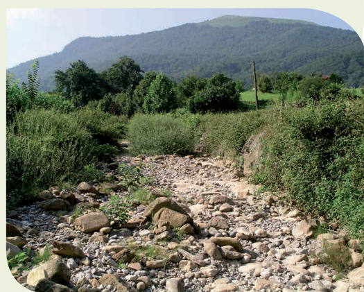
Rivière à sec Pays Basque (64)

Les premières études scientifiques sur le dérèglement climatique montrent des tendances nettes de l'évolution des précipitations, et des débits moyens des principaux fleuves français pour les prochaines décennies : jusqu'à moins 50% en Adour-Garonne en été et en automne, près de moins 20% sur la Garonne et jusqu'à moins 40% sur l'Adour en hiver et au printemps d'ici 2050 2 . Les résultats de ces études montrent que les dérèglements climatiques risquent d'accentuer encore la dépendance de l'agriculture intensive à l'irrigation.