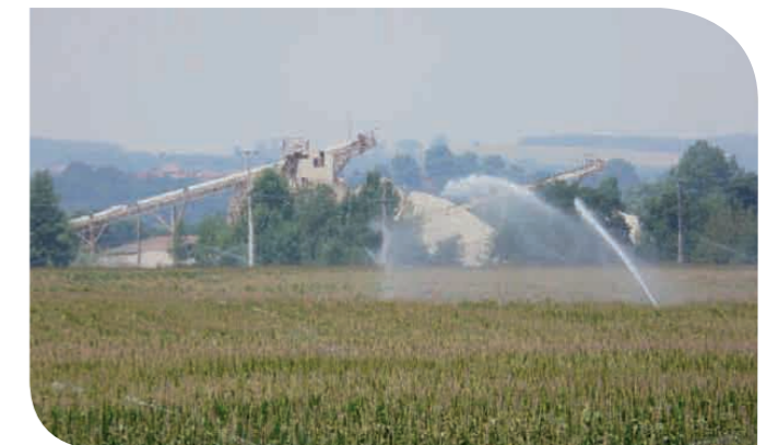
Irrigation du maïs - Basse Vallée de l'Ariège (09)

L'intensification agricole a conduit à la mise en oeuvre de systèmes agronomiques inadaptés aux conditions agro-pédo-climatiques locales. La monoculture de maïs en est le parfait exemple, des millions de m 3 d'eau sont prélevés (entre 2500 et 3000 m 3 /ha/an), essentiellement en été lorsque les cours d'eau sont à sec. Outre les ressources en eau, la maïsiculture nécessite des parades chimiques, herbicides et insecticides, affectant inévitablement la qualité de la « ressource ». L'atrazine a été longtemps la matière active de base des programmes herbicides des cultures de maïs, le glyphosate est de plus en plus employé pour le déchaumage chimique, le Gaucho et le Régent ont été les piliers de la lutte insecticide sur cette culture.