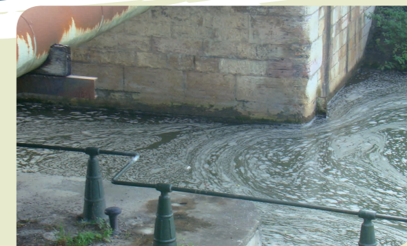
Rejets industriels

Certaines activités économiques (thermalisme, géothermie, stockage de gaz dans des structures géologiques) ont également des impacts sur les ressources en eau souterraine, impacts qui à l'heure actuelle sont insuffisamment évalués.