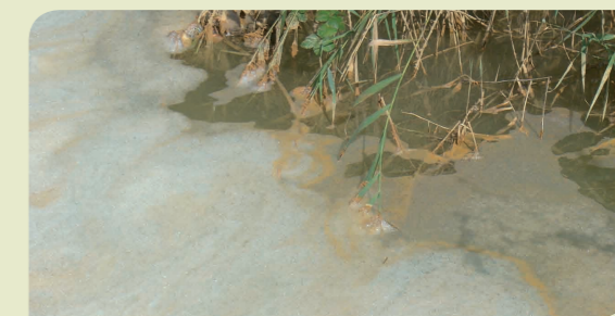
Rejets industriels

Ainsi, les matières polluantes émises par les industries sont de deux natures différentes : les macropolluants organiques (matières organiques et oxydables, matières en suspension, matières azotées et phosphorées), et les micropolluants (substances, organiques [polluants organiques de synthèse : biocides et pesticides, organohalogénés, organophosphorés et organostatiques, hydrocarbures aromatiques polycycliques (HAP), polychlorobiphényles (PCB)] ou minérales (pesticides, métaux, produits dérivés du chlore, arsenic).