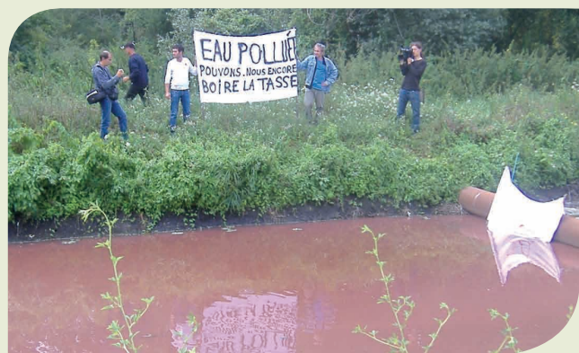
Rejets industriels de l'usine de papier Smurfit Kappa (33)

Les macropolluants organiques sont traités efficacement, lorsque les systèmes d'épuration des industries sont aux normes. Les micropolluants , compte tenu de leur diversité et que les STEP urbaines classiques ne sont pas adaptées pour traiter ce type de polluants, exigent des traitements spécifiques.