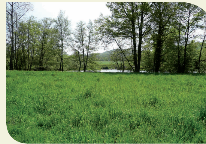
Prairie humide de la Garonne (31)

Au début des années 1990 les teneurs en polluants agricoles augmentaient régulièrement depuis 30 ans. Aujourd'hui, 1.3 millions de Munichois boivent une eau non traitée dont la qualité est proche de celle d'une eau minérale. Et ceci avec un effet sur le prix de l'eau qui est bien moindre que ce qu'aurait entraîné le traitement des eaux brutes 8 .