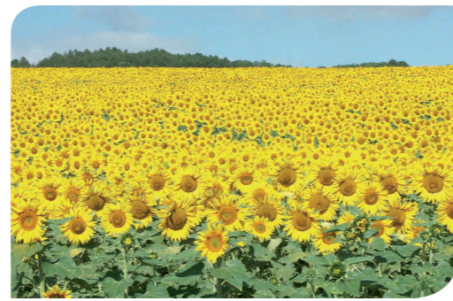
Tournesol - France