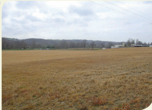
Captage entouré de champs désherbés - Gers Amont (32)

A partir de là, il est possible de proposer un nouveau contrat aux agriculteurs, et de leur demander de s'engager dans l'abandon des pesticides, des engrais chimiques et dans le respect de l'eau. Au préalable à l'application de ces mesures de taxation, il est souhaitable d'obtenir leur adhésion à une nouvelle politique agricole.