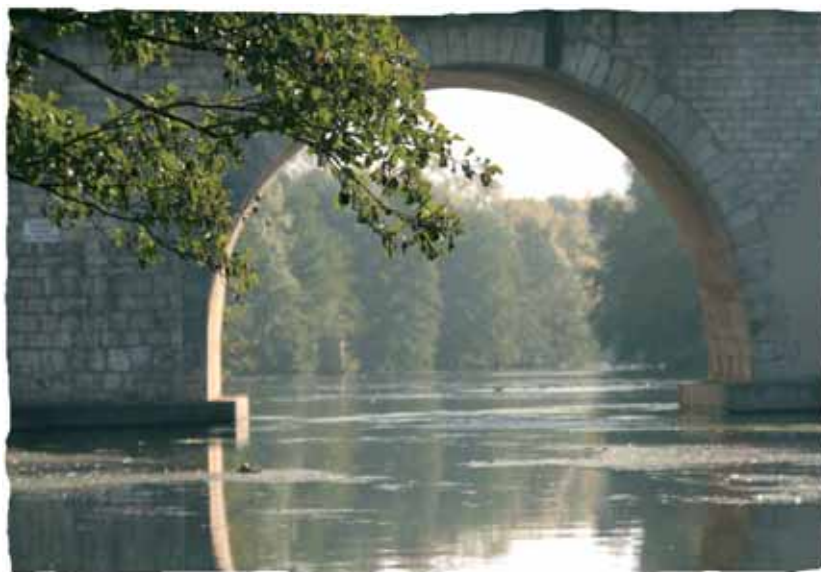
Rivière du Loiret (45)

Disposition à ajouter dans tous les SDAGE : un plan de réduction de l'exploitation de maërl (32) pour arriver à une cessation totale des prélèvements d'ici 2012, et l'interdiction de toute exploitation dans les cinq premiers milles nautiques (en raison de l'importance essentielle des zones de nurseries de la ressource halieutique).